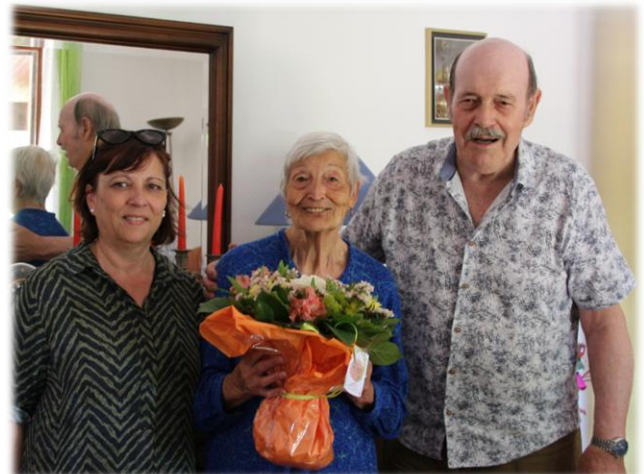
BOUQUET Trinité – 92 ans